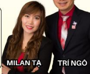
MILAN TA TRÍ NGÔ

tringombaLLC@gmail.com www.TRINGOMBA.com